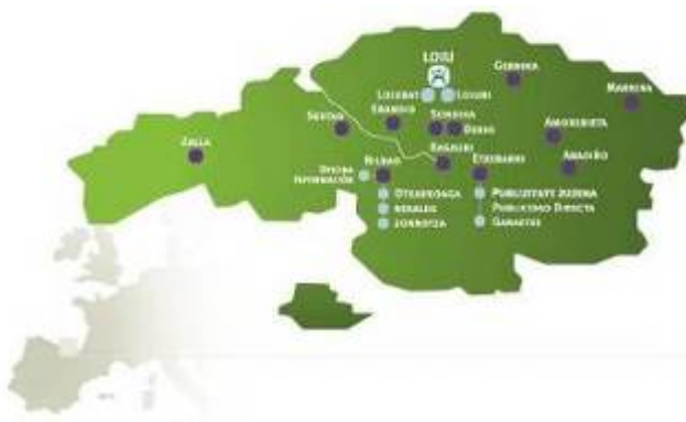
Figura: Distribución geográfica: Bizkaia